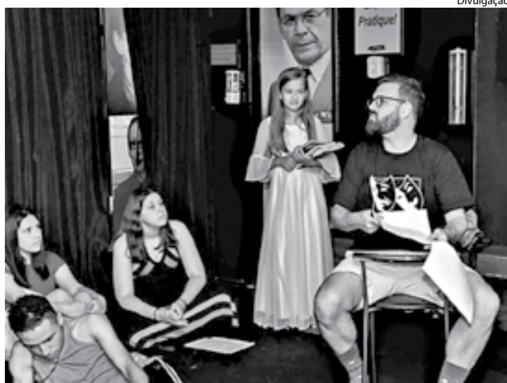
CIA TEM como foco principal a seriedade, dedicação e amor à arte

A Cia Teatral Calegari fica localizada no Ilha Clube, no Ano Bom. Crianças, adolescentes, jovens e adultos que quiserem fazer uma avaliação