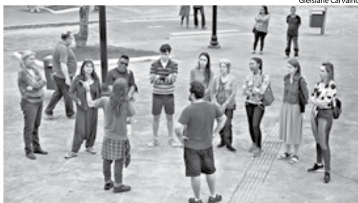
TOUR pelos pontos históricos será toda sexta-feira, exceto em feriados

A oportunidade da visita guiada aos principais pontos históricos também está aberta para outros grupos interessados, mediante inscrição prévia. O agendamento pode ser feito pelo telefone (24) 3354-6927, entre 13 e 17 horas no Arquivo Histórico Municipal. O Passeio Histórico acontecerá toda sexta-feira, exceto em feriados, podendo receber grupos de até 40 pessoas no período da manhã, a partir de 9 horas, e da tarde, às 14 horas.